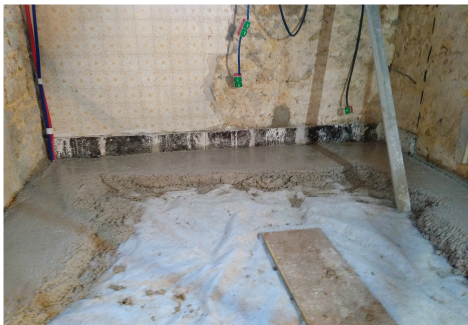
Réalisation de la dalle en octobre 2017

Durant les travaux, les accompagnateurs du projet ont montré comment exécuter correctement et conformément aux règles de l'art certains travaux les plus délicats (dalle chaux pouzzolane, enduit mural en terre et copeaux de bois) et était très facilement joignable en cas de problème.