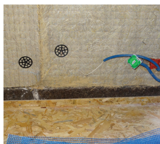
3. Passage de câbles électriques si nécessaire.