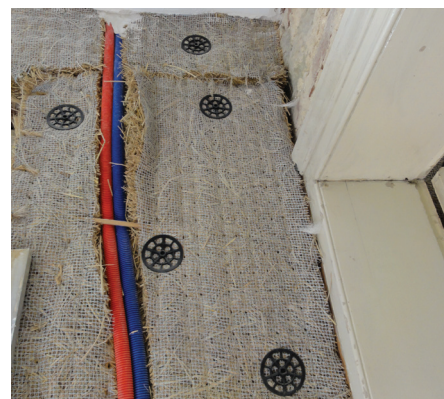
Passage des câbles à travers les panneaux de paille

Des travaux ont été réalisés directement par les propriétaires ou des intervenants extérieurs : plomberie (sanitaire et chauffage), électricité, évacuation des eaux usées, réfection de plafond, réfection de la toiture et rénovation à l'identique des belles voisines en pierre de taille, création de cloisons pour sanitaires et salle de bain, etc.