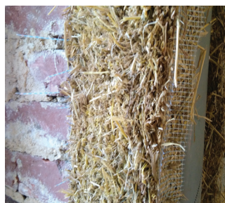
1. Mesure, découpes.

● Préparation du chantier : avant le début du chantier il faut préparer le support de pose. C'est-à-dire qu'il faut retirer tout élément de maçonnerie étranger au mur d'origine de façon à former une surface plane.