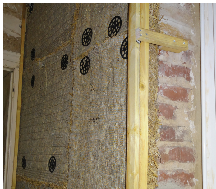
5. Pose de guides permettant une meilleure planéité des murs et des angles.

Mai 2019.