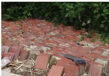
Le réemploi de matériaux, un geste écologique et durable pour les chantiers de construction.