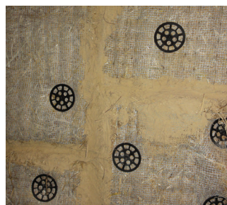
2. Pose des panneaux à l'aide des chevilles de fixation à frapper.