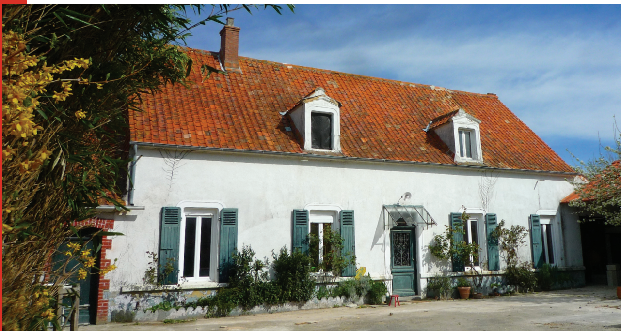
Façade Sud de la maison