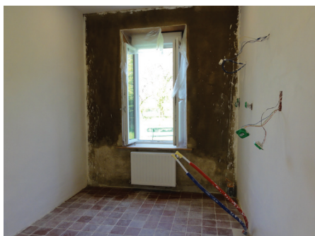
Rendu après travaux d'isolation thermique de la dalle et des murs

Le propriétaire et les accompagnateurs ont réalisé un hérisson de galets permettant d'évacuer une partie de l'humidité vers l'extérieur. Celui-ci a été recouvert d'un géotextile pour éviter les remontées capillaires dans la maison. Enfin, une bande périphérique de liège a été placée pour séparer la dalle respirante et isolante en chaux-pouzzolane du mur.