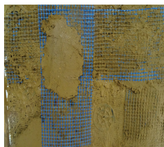
4. Pose d'une trame supplémentaire de jonction si besoin.