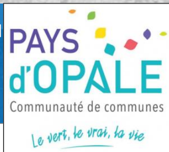
Schéma de développement des énergies renouvelables et de récupération du PNR Caps et Marais d'Opale