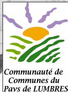
Schéma de développement des énergies renouvelables et de récupération du PNR Caps et Marais d'Opale