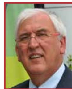
Hervé POHER président honoraire du Parc sénateur du Pas-de-Calais