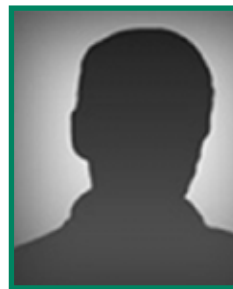
Paul-Marie EVRARD délégué des communes de la CCPO conseiller municipal de Herbinghen