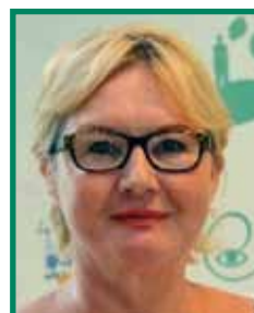
Pascale LEBON Conseillère départementale (Boulogne-sur-mer 2)