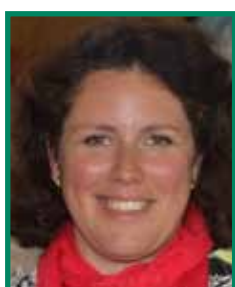
Maïté MULOT-FRISCOURT Conseillère départementale (Calais 1)