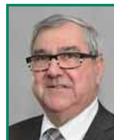
Michel HAMY Conseiller départemental (Calais 1)