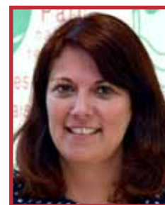
Sophie WAROT Conseillère départementale (Saint-Omer)