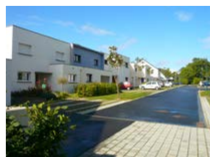
Quartier Chantepie à Rennes

Les végétaux à proximité doivent être d'essences locales et adaptés au stationnement : certaines essences accueillent des insectes dont le miellat tache la carrosserie. (Tilleuls par exemple)