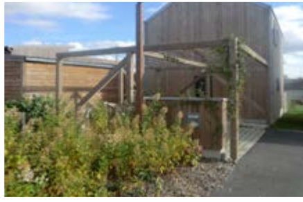
Carports végétalisés à Rennes

Ces carports groupés assurent un gain de place. Dans ce quartier, ils servent notamment d'abri lors des fêtes de voisinage.