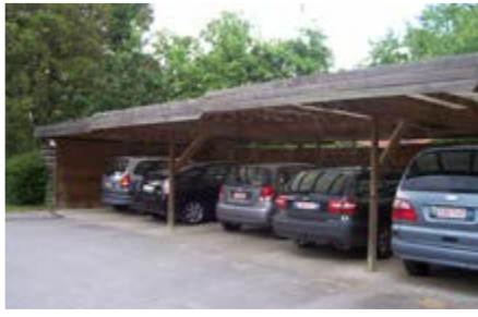
Carports groupés en Belgique

Ces carports groupés assurent un gain de place. Dans ce quartier, ils servent notamment d'abri lors des fêtes de voisinage.