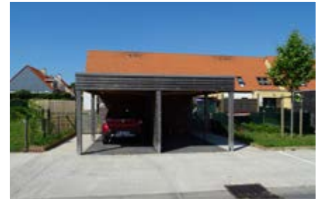
Carports en bois à Wimille

Ce carport partiellement fermé intègre discrètement les coffrets techniques. Végétalisé, il offre aussi de l'ombre en été.