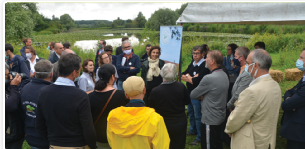
Lors de sa visite en juillet 2020, Audrey Azoulay, la directrice générale de l'Unesco, a apprécié le projet d'extension de la Réserve de biosphère « par souci de cohérence autour de la question de l'eau ».

Depuis sa création, la Réserve de biosphère du marais Audomarois a mené de nombreuses actions et expériences pour mieux préserver les milieux naturels et les ressources, renouer les liens sociaux et améliorer le quotidien de tous.