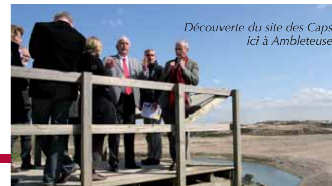
Découverte du site des Caps, ici à Ambleteuse.