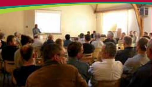
Ruminghem et Wavrans-sur-l'Aa vers un urbanisme de qualité.