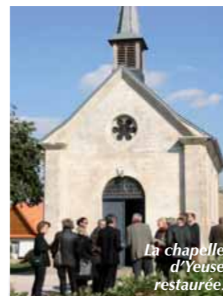
La chapelle d'Yeuse restaurée.