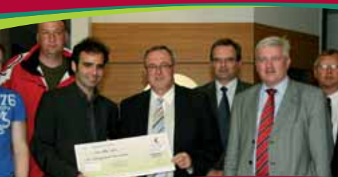
Solidarité avec le marais poitevin.