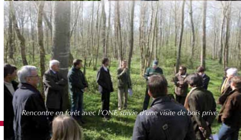
Rencontre en forêt avec l'ONF, suivie d'une visite de bois privé.