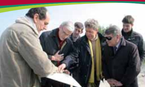
Les rapporteurs du CNPN et de la Fédération en visite.

AUX ÉLUS ET PARTENAIRES - N° 14 JUIN 2010