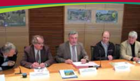
La CAB confie au CSN la gestion de la réserve naturelle du Molinet.