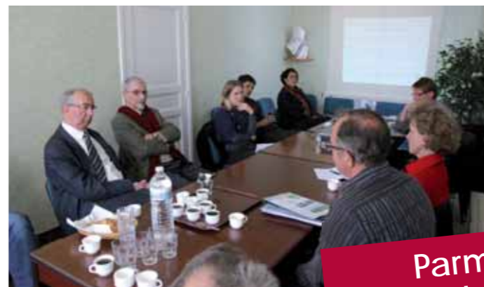
En mairie de Wavrans-sur-l'Aa.