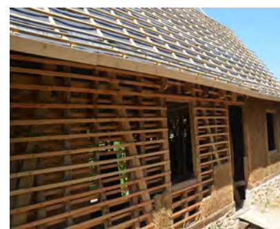
Le torchis a repris sa place début juillet 2016 avec la participation d'amis des propriétaires.