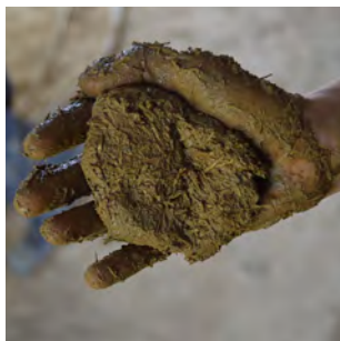
1. Le mélange doit être collant et assez dense pour tenir dans la main.

La veille, humidifier la surface puis un peu avant de commencer l'enduit et au cours du chantier.