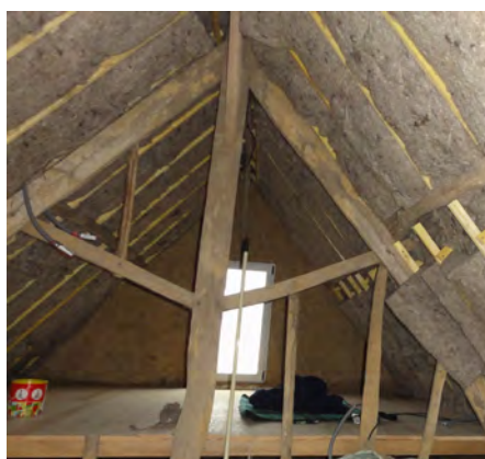
La laine de mouton va être recouverte de canisses de roseaux enduits.