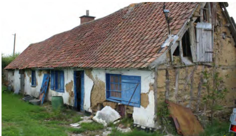
État initial de la maison au moment de l'acquisition en décembre 2015.

Pour ce chantier, la maison nécessitant des travaux sur l'ensemble des murs et la toiture, le diagnostic énergétique n'a pas été réalisé.