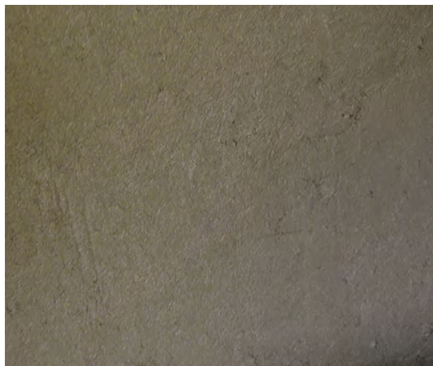
5. L'enduit a été serré avant séchage. Il recevra ultérieurement une peinture à l'argile colorée (un badigeon ou une autre peinture naturelle pourrait être également utilisé).