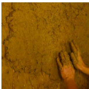
3. Répartir légèrement la matière avec les mains. Une fois que la première couche sèche en surface, renouveler les opérations 2 et 3.