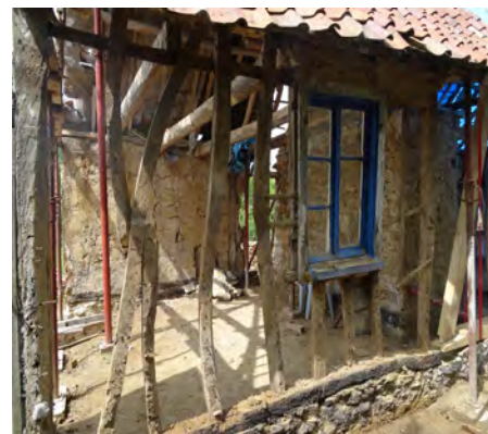
État de l'ossature bois après avoir retiré le torchis en mai 2016.

Malgré son état de dégradation, la maison a gardé de nombreux détails architecturaux caractéristiques de l'architecture vernaculaire qui lui donnent toute son authenticité. Des préconisations ont été définies par l'architecte pour préserver ces caractéristiques lors des travaux.