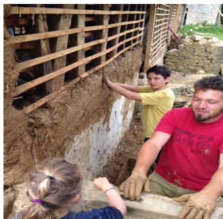
Tout le monde peut participer à l'auto-réhabilitation accompagnée !

«Pour notre projet, les conseils architecturaux et techniques étaient les bienvenus. De plus, nous souhaitions rendre ce chantier convivial et participatif. L'auto-réhabilitation accompagnée nous a paru être l'outil idéal.»