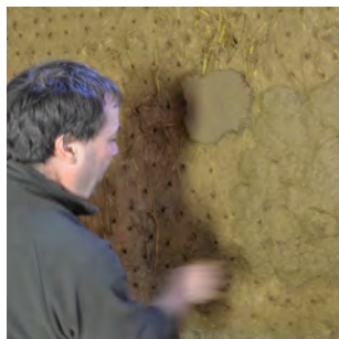
2. Technique retenue : lancer des boulettes d'enduit de taille identique les unes à côté des autres.