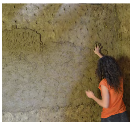
Pose de la première couche d'enduit en septembre 2016.

Le propriétaire et l'artisan ont fabriqué et posé un enduit correctif à caractère isolant terre-anas de lin en deux couches identiques d'environ 6 à 8 centimètres d'épaisseur au total. La pose de ce matériau peu connu a fait l'objet d'un stage participatif (voir ci-dessous).