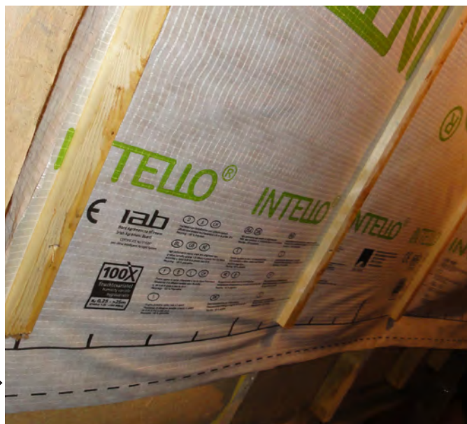
4. La première bande est posée. La seconde bande sera ensuite fixée avec un chevauchement d'environ 10 cm sur la première. Le chevauchement des bandes sera collé avec un ruban adhésif adapté. Il faut frotter le ruban pour qu'il adhère correctement au support.