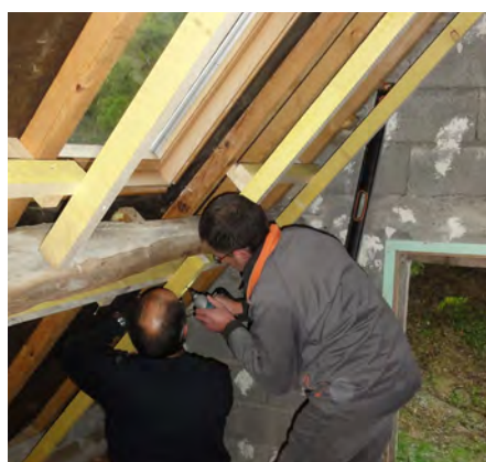
Pose de la structure en bois, le 19 novembre 2016.