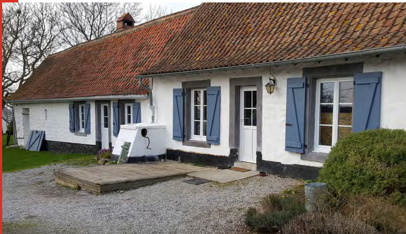
Façade Sud de la maison.

RETOUR D'EXPÉRIENCE CHANTIER 2016 - RÉTY