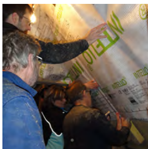
1. Dérouler et poser la membrane. Attention à ne pas l'endommager.