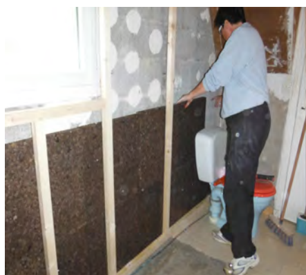
Pose du liège en partie basse du pignon, le 29 juillet 2016.

Ce pignon a été isolé avec des panneaux de liège de 8 cm en partie basse (le liège étant imputrescible, il ne craint pas l'eau), puis avec des panneaux de laine de bois de 8 cm. Une membrane étanche a ensuite été posée pour assurer l'étanchéité à l'air du mur. Dans notre cas, il s'agit d'une membrane d'étanchéité à l'air en plastique. Il existe de multiples matériaux en remplacement de cette membrane (panneaux d'OSB, enduit chaux, terre, plâtre, etc.).