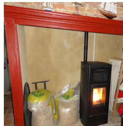
Poêle à granulés de bois de 11kW.

Un enduit à base de chaux a été appliqué sur les murs extérieurs. De plus, la cuisine et la salle de bain ont été entièrement rénovées.