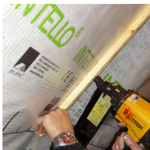
2. Maintien de la membrane avec des liteaux en bois. Les liteaux sont fixés à l'aide d'une agrafeuse pneumatique ou d'une visseuse.