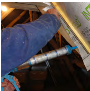
3. Pose d'un joint colle pour maintenir la membrane sur l'entrait de la charpente. Etape indispensable pour assurer l'étanchéité à l'air entre la membrane et les points difficiles (jonction membrane-bois...).